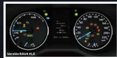
Versión RAV4 XLE

La nueva RAV4 cuenta con un tablero de instrumentos análogos con pantalla TFT central de multiinformación de 7" para la versión Limited y de 4.2" para la versión RAV4 XLE.