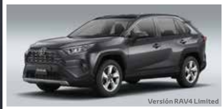
Versión RAV4 Limited

Con su potente presencia y un diseño sofisticado este vehículo inspira a la aventura. Su énfasis en la parrilla robusta aumenta la aerodinámica del vehículo y su capacidad de refrigeración del motor, sus faros han sido diseñados en contraste con la parrilla dando una apariencia de elegancia y sofisticación. Sus líneas exteriores le dan mayor realce de elegancia y look deportivo.