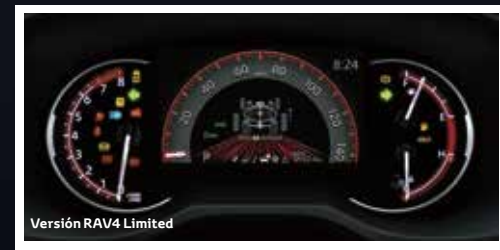
Versión RAV4 Limited