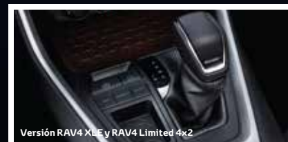
Versión RAV4 XLE y RAV4 Limited 4x2