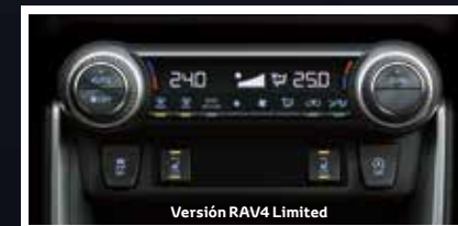
Versión RAV4 Limited

El aire acondicionado dual, con control de dos zonas ofrece un ajuste de temperatura independiente para los ocupantes. También cuenta con modo de eliminación de polen que permiten que todos se sientan más cómodos a bordo minimizando las impurezas del aire.