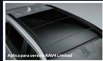
Aplica para versión RAV4 Limited