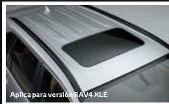
Aplica para versión RAV4 XLE

Disfruta la sensación de libertad que genera el sentir el viento y poder disfrutar de una noche estrellada con el techo panorámico en versión RAV4 Limited y techo corredizo en la versión RAV4 XLE el cual se puede ajustar en apertura total o parcial.